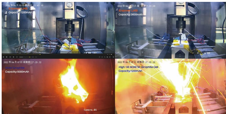
図1. 釘刺し試験比較画像

います。また、30社以上のエネルギー関連企業とも連携し、革新的な次世代電池の実用化を通じた脱炭素社会の実現に貢献します。